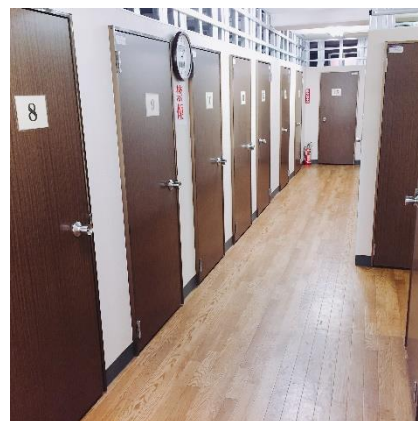
33室トランクルーム内