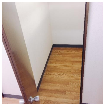
No8 1.71 m 2